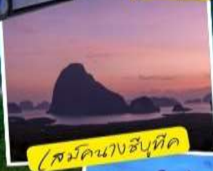
ชมดินนางสีบูนิด