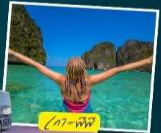
เกาะพีพี