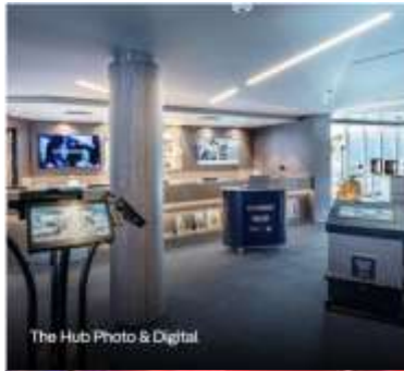
The Hub Photo & Digital