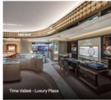
Time Valloø - Luxury Plaza