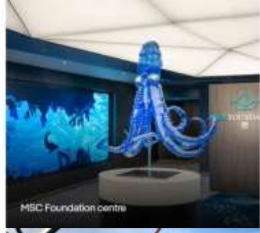
MSC Foundation centre