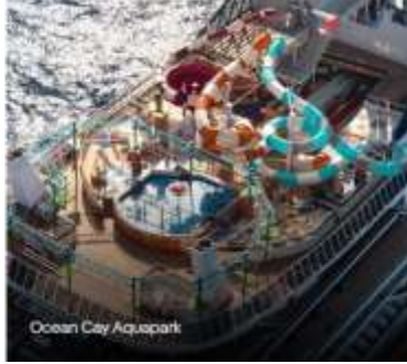
Ocean City Aquapark