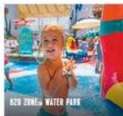
B20 ZONES WATER PARK