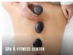
SPA & FITNESS CENTER