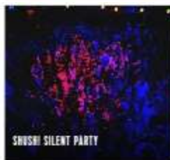
SHUSHI SILENT PARTY