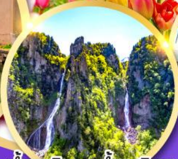
น้ำตกกิ่งกะ-น้ำตกริวเซ