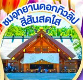
ชมอุทยานดอกทิวลิป สีสันสดใส