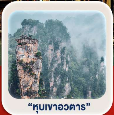
"หุบเขาอวตาร"