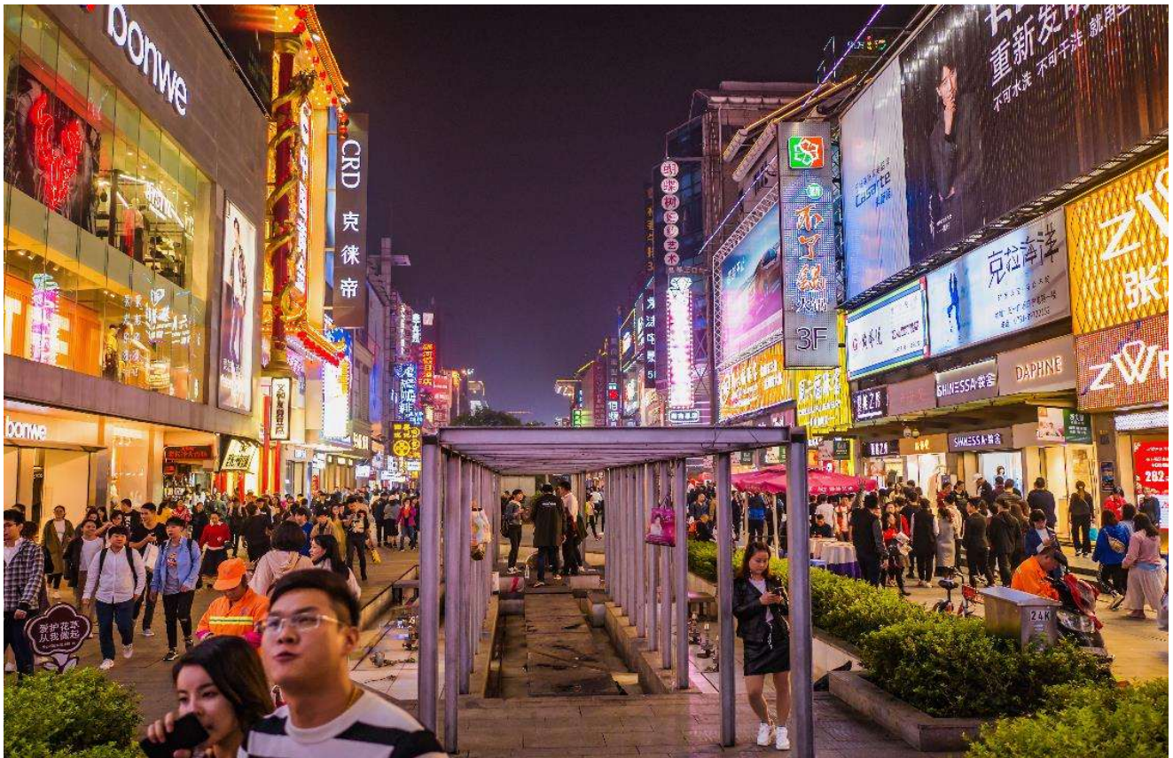
T2G-CSX16SL ZhangJiajie...ฉางซา จางเจียเจี๋ย ฟู่หลงเจิ้น เฟิ่งหวง สะพานแก้ว 6D 5N (SL)