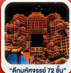
"ตึกมหัศจรรย์ 72 ชั้น"