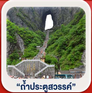
"กำประตูลงสวรรค์"