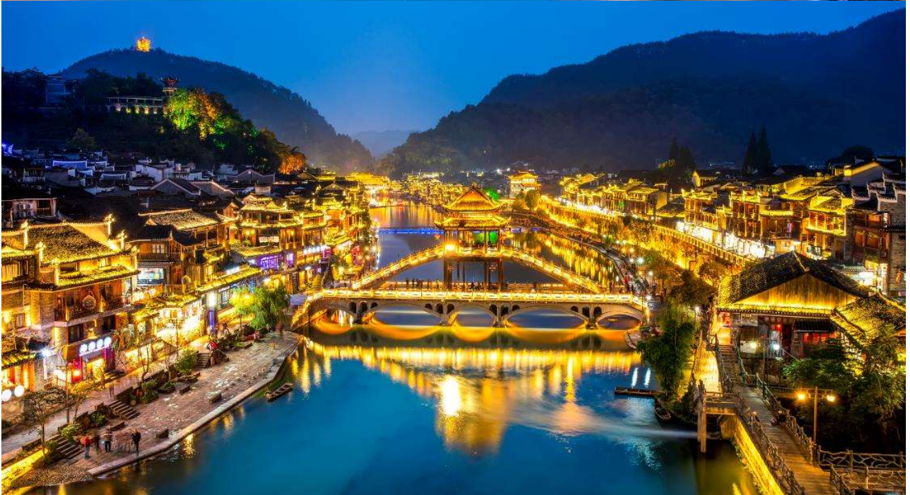
T2G-CSX16SL ZhangJiaJie...ฉางซา จางเจียเจีย ฟู่หลงเจิ้น เฟิ่งหวง สะพานแก้ว 6D 5N (SL)