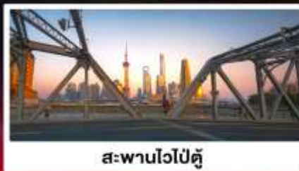
สะพานไวโปตุ