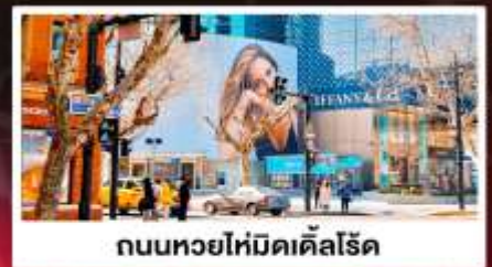
ถนนหอยไหมดิสไลด์