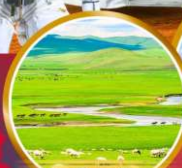
ทุ่งหญ้าออร์คอส

พิเศษ!!! สองชุดของโกเลีย บนกระโจมของโกเลีย