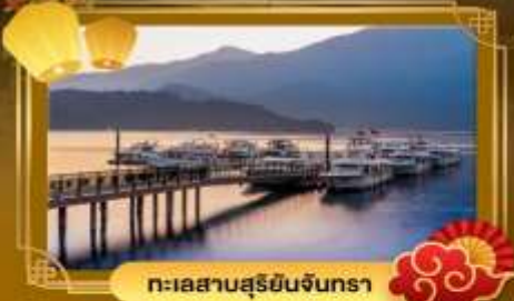
ทะเลสาบสุริยอินจันตรา