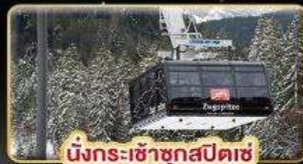
นั่งกระเช้าชุกสปีตซ์