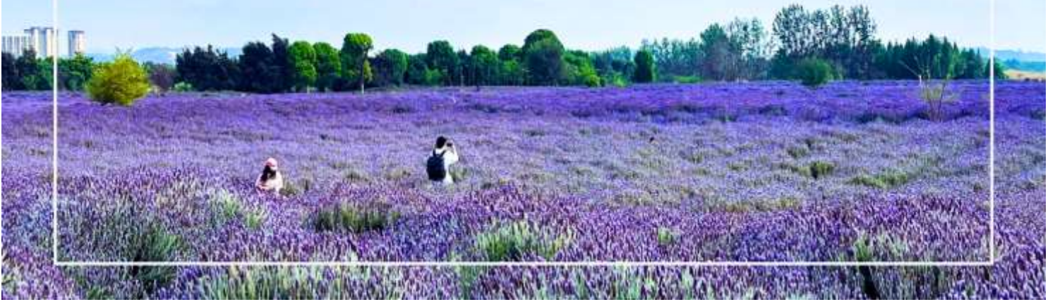
สวนดอกไม้ลาวยูเหอ (Laoyu River Flower Garden)