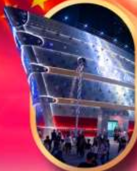
เรือเดอะหลุยส์