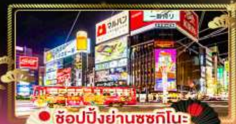
● ช้อปปิ้งย่านซุกุชิโนะ