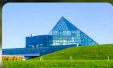
Glass Pyramid HIDAMARI