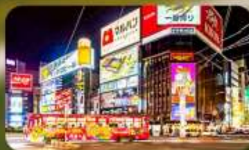
ซุปpingย่านซุซุกิโนะ