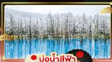
● บ่อน้ำสีฟ้า

สัมผัส ซากุระแรกฤดู และหิมะท้ายฤดูแห่งปี สีสันแห่งชีวิตชีวา