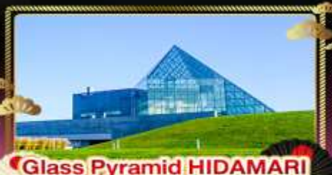
● Glass Pyramid HIDAMARI