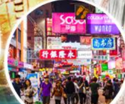
Shopping Taim Sha Tsui