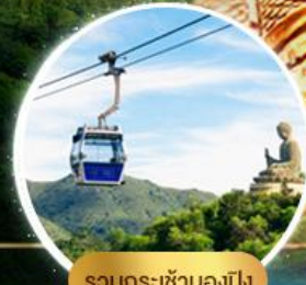
รวมกระเช้าฮ่องกง