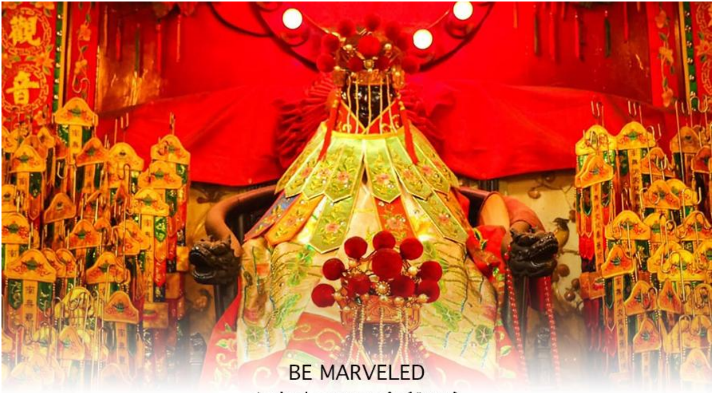
BE MARVELED วัดเจ้าแม่กวนอิมฮองอ่า (ยิมวิน)

ที่จัดขึ้นในทุกๆปี พิธีนี้จะมีเพียงครั้งปีละครั้งเท่านั้น เป็นวันสำคัญอีกวันที่คนหลังไหลมาไหว้ขอพรอย่างไม่ขาด สาย