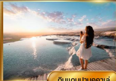
ดินแดนปามุคคาเล่