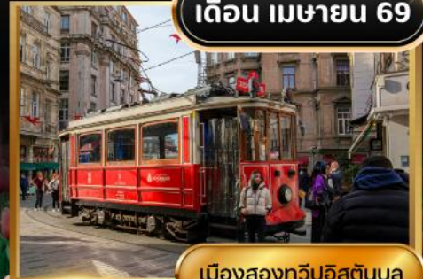
เมืองสองทวีปอิสตันบูล