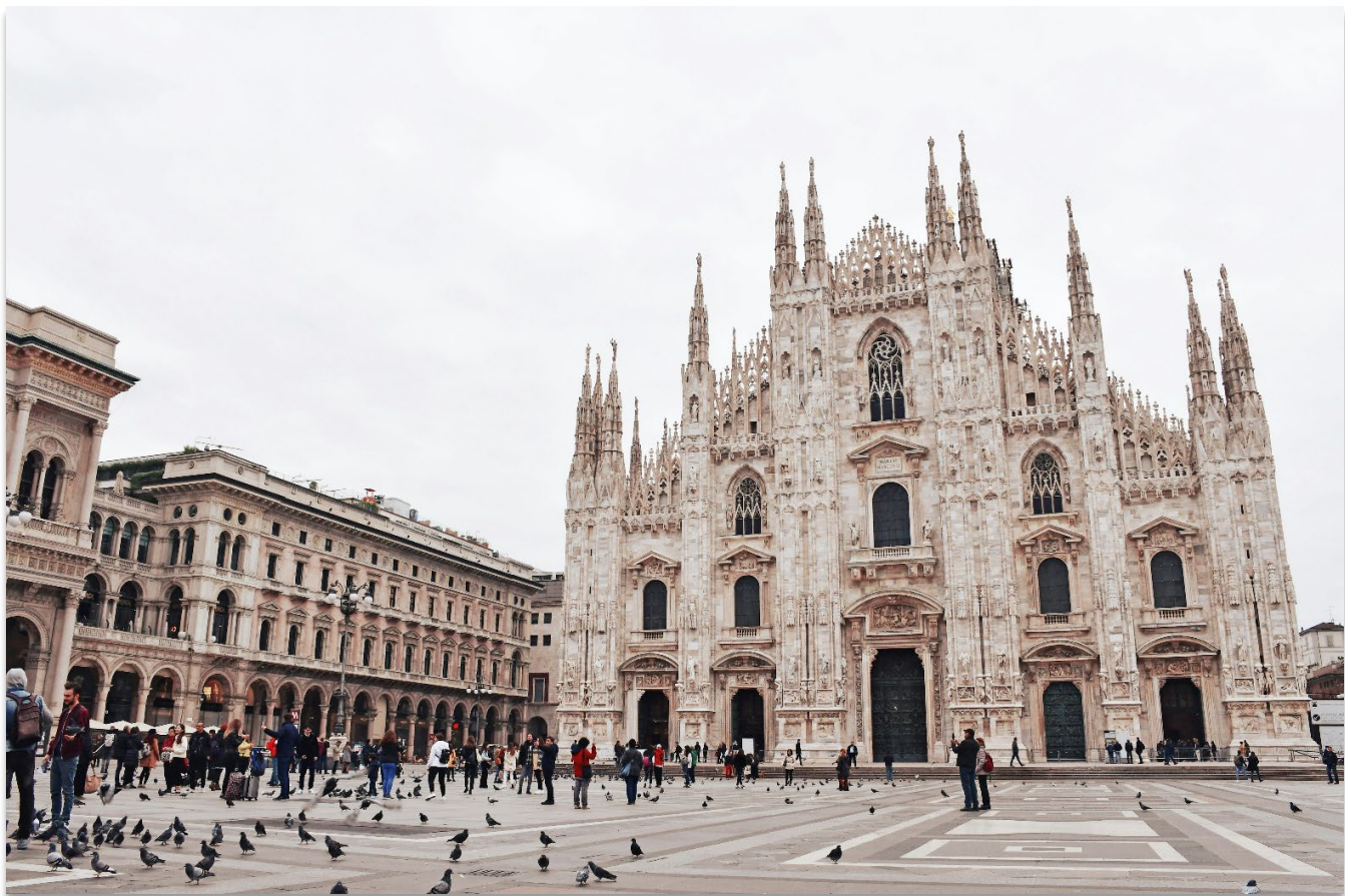
DUOMO DI MILANO

เมืองมิลาน (Milan) มิลานเป็นเมืองสำคัญทางตอนเหนือของประเทศอิตาลี ตั้งอยู่บนที่ราบลอมบาร์ดี โดยชื่อ "มิลาน" มีรากศัพท์มาจากภาษาของชาวเซลต์ คือ "Mid-Lan" ซึ่งมีความหมายว่า “กลางที่ราบ” เมืองมิลานมี ชื่อเสียงระดับโลกในด้านแฟชั่น ศิลปะ และวัฒนธรรม และยังเป็นหนึ่งในเมืองหลักทางเศรษฐกิจของอิตาลีอีก ด้วย นำท่านถ่ายภาพเป็นที่ระลึกบริเวณด้านหน้าของ “มหาวิหารมิลาน” (Duomo di Milano) หนึ่งในมหา วิหารสไตล์กอธิคที่ใหญ่ที่สุดในโลก (ค่าทัวร์ไม่รวมค่าเข้าชมในของมหาวิหารแห่งเมืองมิลาน)นอกจากนั้นให้