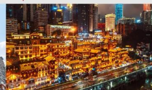
หงหยาดัง(ตอนกลางคืน)

*ทางบริษัทฯ ขอสงวนสิทธิ์ในการสลับโปรแกรมทัวร์ตามความเหมาะสมขึ้นอยู่กับสถานการณ์หน้างาน โดยคำนึงถึงผลประโยชน์ของลูกค้าเป็นสำคัญ