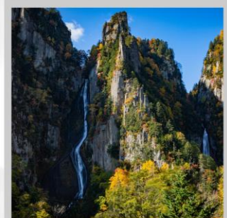
"GINGA & RYUSEI FALLS"

ต้นตอ “ทุ่งดอกพืชมอส ณ สวนดอกชิบะซากุระฮิงะชิโมะโคะโคะ” ด้วยพรมสีชมพูที่มีพื้นที่ขนาดใหญ่ถึง 100,000 ตารางเมตร ชม “ทะเลสาบคาบสมุทรชิเรโตโกะ” เกิดมาจากการระเบิดของภูเขาไฟโอโอะและน้ำพุใต้ดิน จนเกิดเป็นทะเลสาบทั้ง 5 ของชิเรโตโกะ “ฟาร์มสุนัขจิ้งจอกฮอกไกโด” ฟาร์มสุนัขจิ้งจอกแห่งเดียวของเกาะฮอกไกโด สายพันธุ์ท้องถิ่นคือ สายพันธุ์ Ezo red fox ผลิตเพลินกับ “เนินสีฤดู” เนินเขากว้างใหญ่ที่มีดอกไม้ไม้บานาพันธุ์นับ 30 ชนิดปลูกเรียงรายสลับสีกันเป็นแนวยาว นำท่าน “นั่งกระเช้าภูเขาคุโรดะเคะ” เชื่อมจากเชิงเขาของเมืองโซอุนเคียวถึงยอดเขาคุโรดะเคะเคะที่มีความสูงถึง 670 เมตร ไฮไลท์ “ส่องเรือราอูสี ชมความงามของวาฬเพชรฆาต” บริเวณคาบสมุทรชิเรโตโกะ มรดกโลกทางธรรมชาติของฮอกไกโด