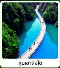
หุบเขาสิงโต