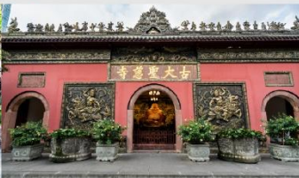
วัดต้าเจ้อ

*ทางบริษัทฯ ขอสงวนสิทธิ์ในการสลับโปรแกรมทัวร์ตามความเหมาะสมขึ้นอยู่กับสถานการณ์หน้างาน โดยคำนึงถึงผลประโยชน์ของลูกค้าเป็นสำคัญ