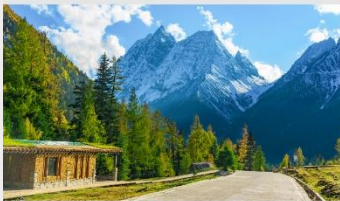
ภูเขาสี่ดรุณี (หุบเขาชวงเจียวโกว)