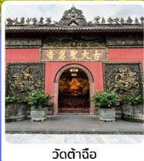
วัดต้าเจ้อ