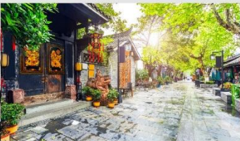
ซอยกว้างชอยแคบ