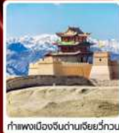
กำแพงเมืองจีนด่านเจี๋ยวีกวน

• ไฮไลต์...เส้นทางสายไหม ชมสระบัววังพระจันทร์ ทะเลทรายผิงซาซาน กำแพงเมืองจีนด่านสุดท้าย "เจี๋ยวีกวน" มรดกโลกภูเขาสายรุ้งจางเย่