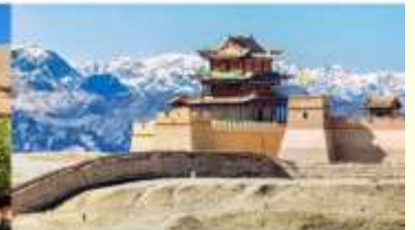
กำแพงเมืองจีน ด่านเจียยวี่กวน

*ทางบริษัทฯ ขอสงวนสิทธิ์ในการสลับโปรแกรมทัวร์ตามความเหมาะสมขึ้นอยู่กับสถานการณ์หน้างาน โดยคำนึงถึงผลประโยชน์ของลูกค้าเป็นสำคัญ