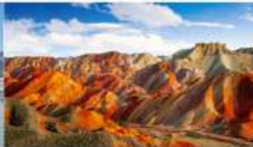
หุบเขาสายรุ้งจางเย่