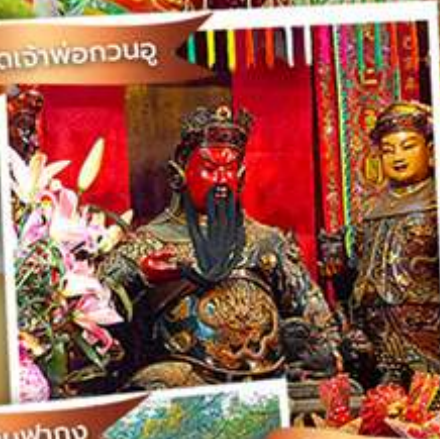
วัดหลินฟาง