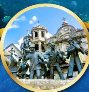
อนุสาวรีย์มรดกแห่งเซบู