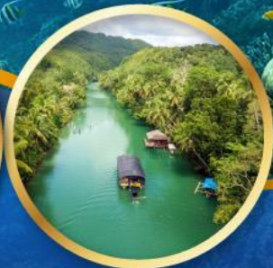
ล่องเรือแม่น้ำโลบ็อก