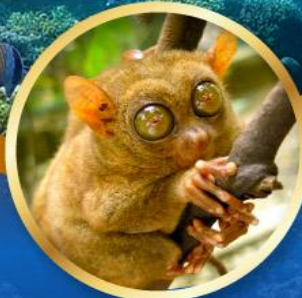
ลิงทาร์เซีย