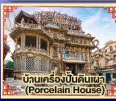
บ้านเครื่องปั้นดินเผา (Porcelain House)