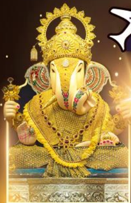
องค์ตั้งบูชท์พิเศษ