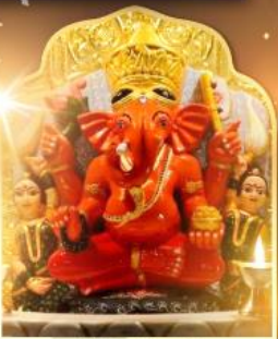
องค์สิทธินายิก