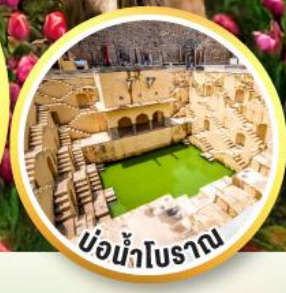
บ่อน้ำโบราณ