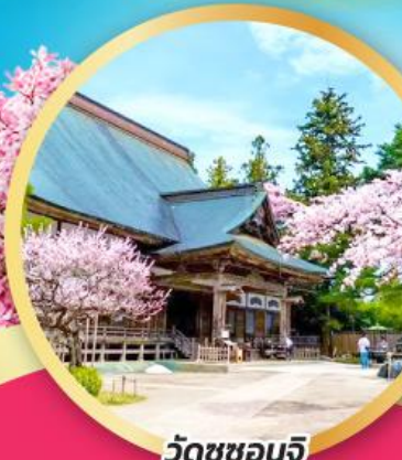
วัดชูซอนจิ