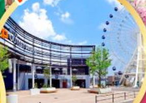
มิตรชุยเอาก์เลิตพาร์ค เซนได