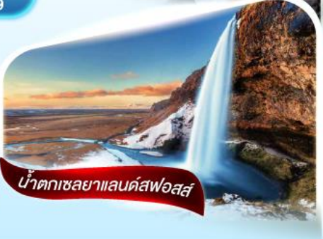
น้ำตกเซลยาแลนด์สฟอสส์