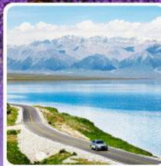
ทะเลสาบไซไห่ลู่มุ