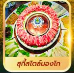
สุกีสโตลิมองโก