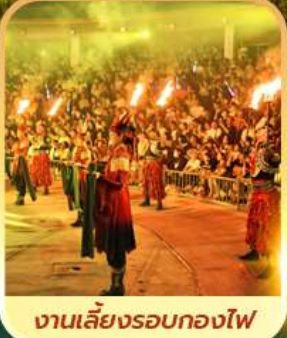
งานเลี้ยงรอบกองไฟ