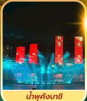
น้ำพุคังบาซี