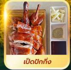
เบ็ดปักกิ้ง