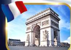
ประตูชัยอาร์กเดอทรียงฟ์