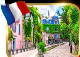
Rue de l'Abreuvoir มงมาร์ต