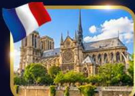
มหาวิหารนอร์ม็องดี