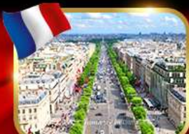
เดินเล่นย่านช็องเซลีเซ