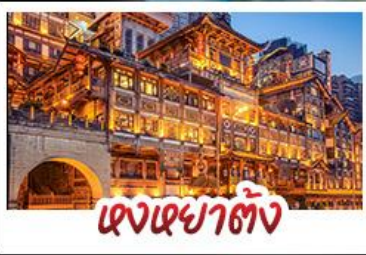
เจียงหยาดัง