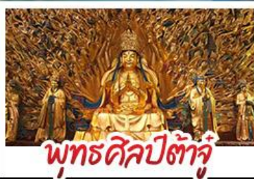
พุทธศิลป์ต้าจู๋