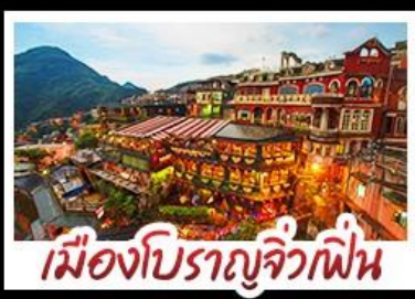
เมืองโบราณจีวเฟิน