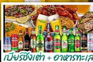
เบียร์ชิงเต่า + อาหารทะเล