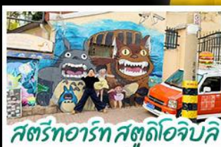
สตรีทอาร์ต สตูดิโอจิบลิ