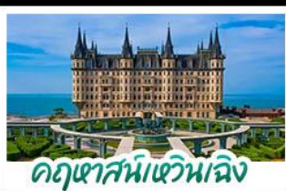
คฤหาสน์เหวินเจิง

เมืองท่าชิงเต่า - คฤหาสน์เหวินเจิง เบียร์ชิงเต่า + อาหารทะเล สตรีทอาร์ต สตูดิโอจิบลิ