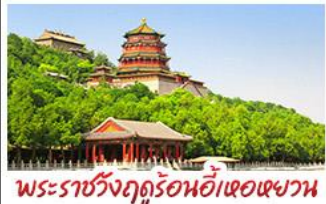
พระราชวังฤดูร้อนอีเหอหยวน

กำแพงเมืองจีนด่านจวิรงกวน - พระราชวังฤดูร้อนอีเหอหยวน สวนจิ่งอัน - วัดลามะ - ไหม่หลงร้านช้อปปิ้ง - โรงแรม 4 ดาว บ๊อพิซซเปิดปักกิ่ง สุกี่มองโก MICHELIN GUIDE ร้าน TAO TAO JU