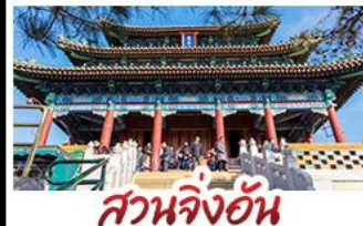
สวนจิ่งอัน