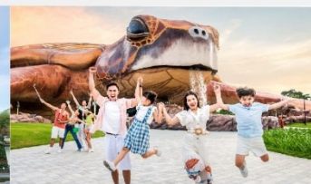
วินเพิร์ล อควาเรียม

*ทางบริษัทฯ ขอสงวนสิทธิ์ในการสลับโปรแกรมทัวร์ตามความเหมาะสมขึ้นอยู่กับสถานการณ์หน้างาน โดยคำนึงถึงผลประโยชน์ของลูกค้าเป็นสำคัญ