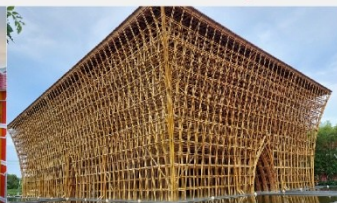
บ้านไม้ไฟ