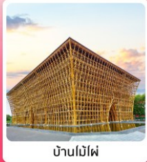
บ้านไม้ไผ่

ไอโวลท์ เทียวครบ สวนน้ำ Aquatopia & สวนสนุก Vin Wonder เวนิสแห่งเวียดนาม Grand World Phu Quoc แลนด์มาร์คสุดโรแมนติก