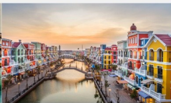
แกรนด์เวิลด์ฟู้ท๊วก