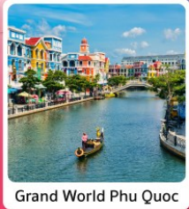
Grand World Phu Quoc