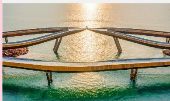
สะพานจูป