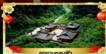
อุถยานหลุมฟ้า