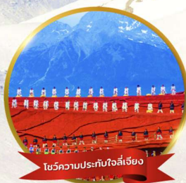
โซว์ความประทับใจลี่เจียง