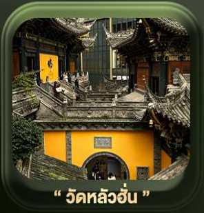
“ วัดหลว้ออัน ”