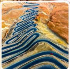
ถนนผานหลงกู่ต้าว