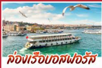
ล่องเรือบอสฟอรัส