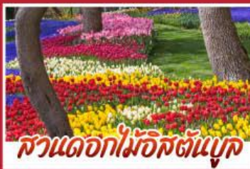
สวนดอกไม้อิสตันบูล