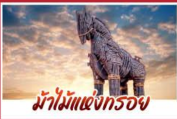
ม้าไม้แห่งกรวย