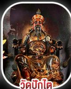
วัดบิกิต