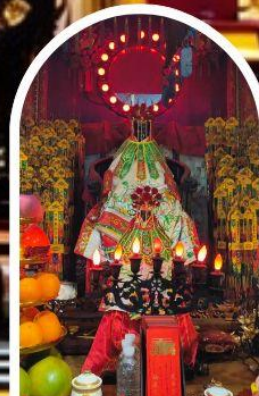
วัดเจ้าแม่กวนอิมอ่องฮำ ขอพรเรื่องเงิน ทรัพย์สิน และความมั่งคั่ง