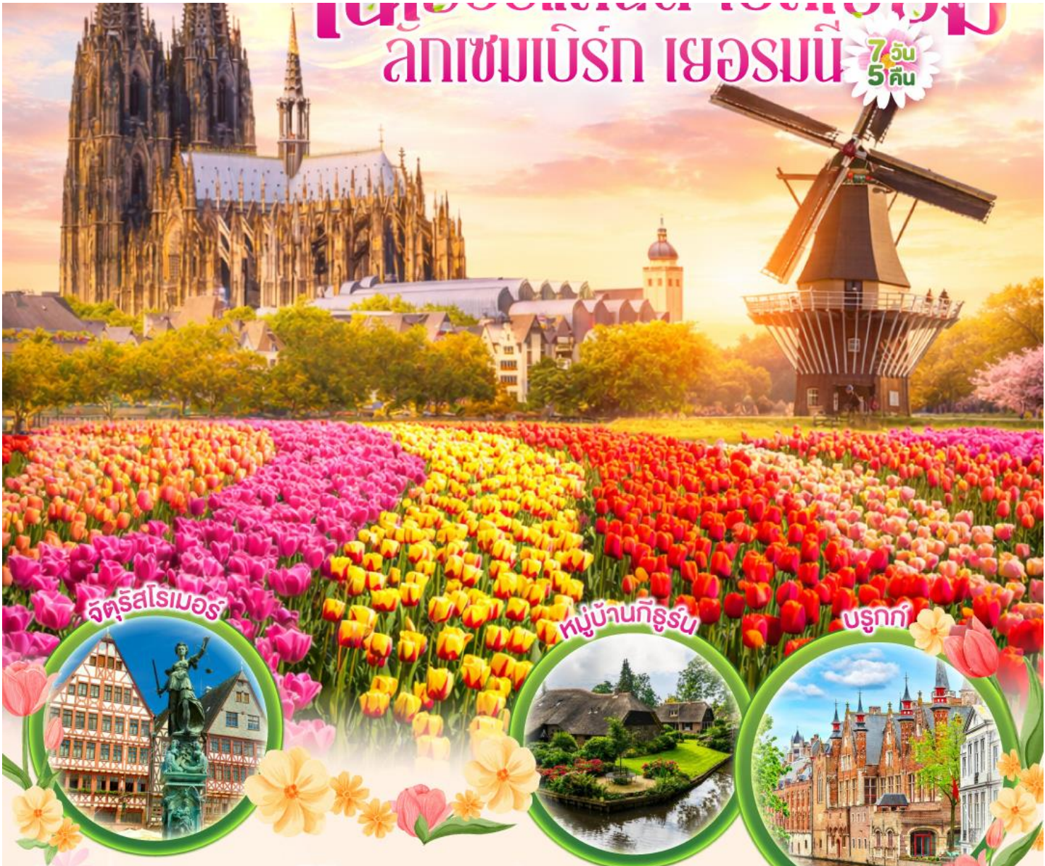
จตุรัสโรเมอร์