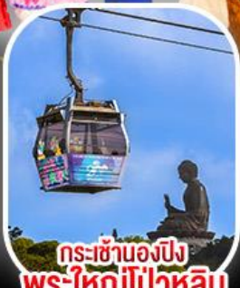
กระเช้าเองปีง พระใหญ่ไผ่หลิน