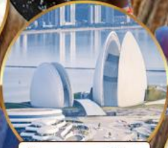
โรงแรมหรูไฮมุก