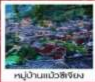
หมู่บ้านเม้งช้งม้ง