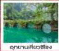
อุทยานเสี้ยวช้ง