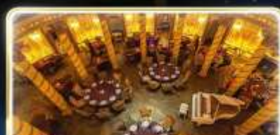
ทานอาหารสุดหรู ร้านTurandot