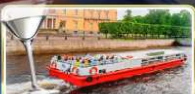
ล่องเรือแม่น้ำวอวา พร้อมเสิร์ฟ Vodka Tasting

📅 เดินทาง : 14-21 มิ.ย.69 / 28 มิ.ย.-05 ก.ค.69 / 24-31 ก.ค.69