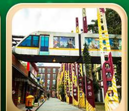
“ตงเจียวจั้อ”