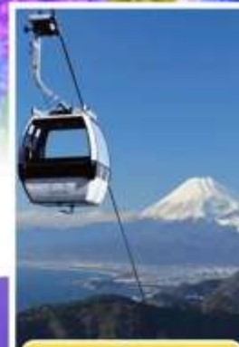
อิซุพานรามาวิว