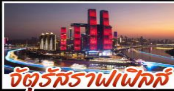
จัตุรัสราฟเฟิลส์