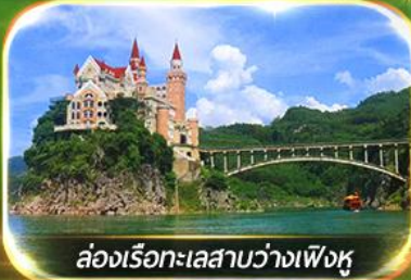
ล่องเรือทะเลสาบว่างเฟิงหู